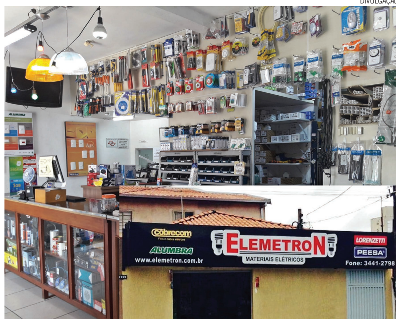
A Elemetron conta com uma grande variedade de produtos para atender as necessidades de seus clientes

Para saber mais sobre a loja e os produtos que oferece, o consumidor pode acessar o site www.elemetron.com.br , ou acompanhar a empresa em sua página no Facebook: @elemetron.