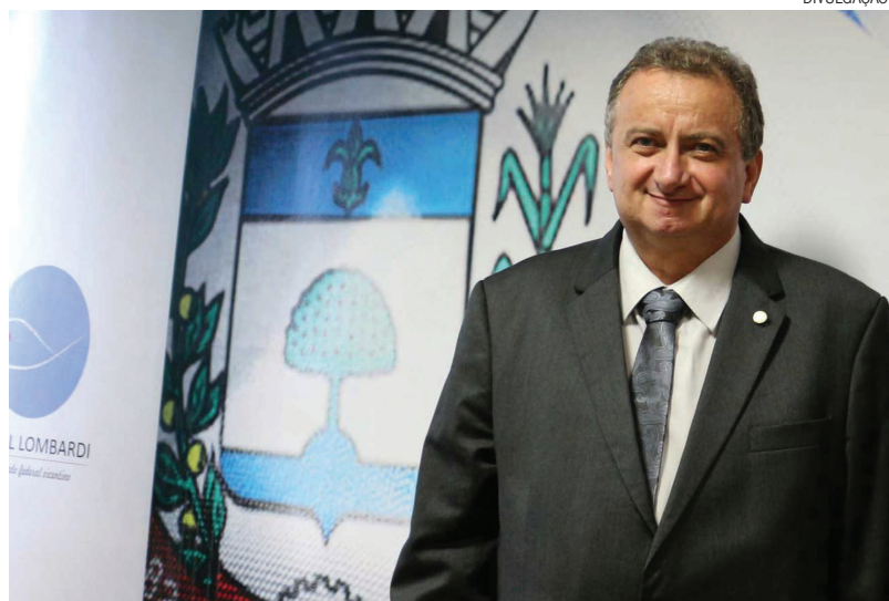
“Trabalho que dá resultado positivo para população e biografia limpa. Este é o meu maior patrimônio”, destaca o deputado federal Miguel Lombardi

O deputado federal Miguel Lombardi aparece em primeiro lugar no ranking que monitora e avalia a eficiência dos deputados e senadores no Congresso Nacional. A lista é divulgada pelo site independente Ranking dos Políticos ( http://www.politicos.org.br )